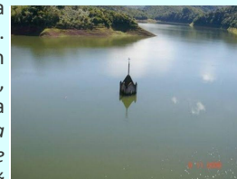
Iglesia hundida en el Lago Caonillas.