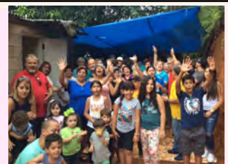
Actividad de verano 2016