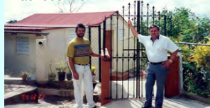
Anterior casa de la Familia Pacheco Mori.