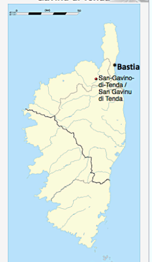
Localización de San-Gavino-di-Tenda / San Gavino di Tenda en Córcega