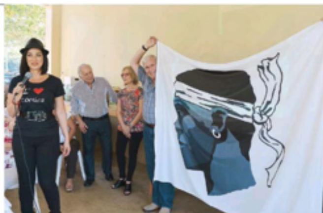
La presentadora Carmen Dominicci, de ascendencia corsa, fue la invitada especial durante el 30 aniversario del grupo.

Durante el encuentro no hubo distinción de pueblos, sino que todos parecían una sola familia. Allí, en el Hotel